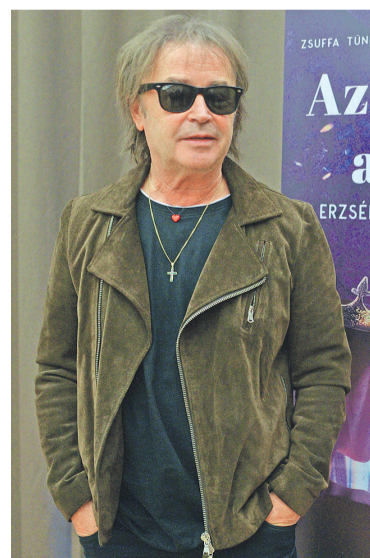
A zeneszerző

A produkció a tervek szerint a budapesti bemutatót követően jövő tavasszal indul a Kárpát-medencében. Zsuffa Tünde író, a zenés mű alapjául szolgáló regény szerzője a produkció sajtótájékoztatóján felidézte, hogy Ferenc pápa a Nemzetközi Eucharisztikus Kongresszus zárómiséjén két magyar szentet emelt ki: az államalapító Szent Istvánt és Szent Erzsébetet. Az író szerint a musical a hazaszeretetre fog tanítani. Arról is beszélt, hogy a művel rehabilitálni szeretné Gertrúd királynét, akit Erzsébet mellett szintén a sze-